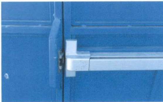
Foto 5: Reparación de chapa de portones y soldadura de puntos de sujeción